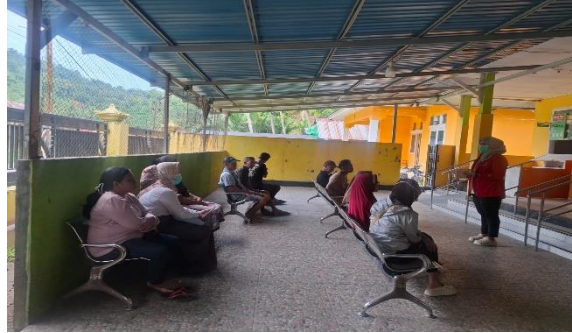
Gambar 1. Kegiatan Pengisian Kuesioner Pre-Test

Melaksanakan penyuluhan kesehatan tentang stimulasi deteksi dan intervensi tumbuh kembang pada balita menggunakan poster yang disampaikan oleh pelaksana kegiatan.