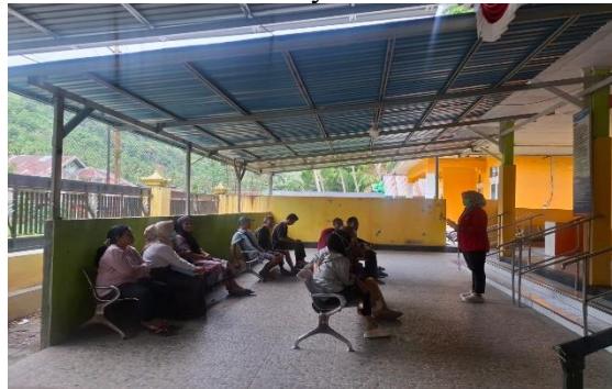
Gambar 4. Foto Permohonan Persetujuan Pelaksanaan Kegiatan